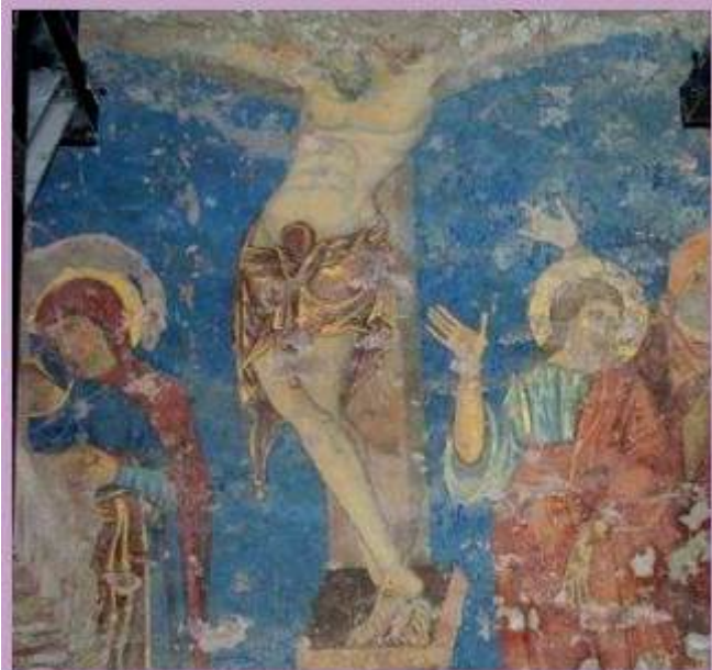
Anonimo senese terzo quarto XIII sec. "Crocifissione" Siena, "cripta" del Duomo