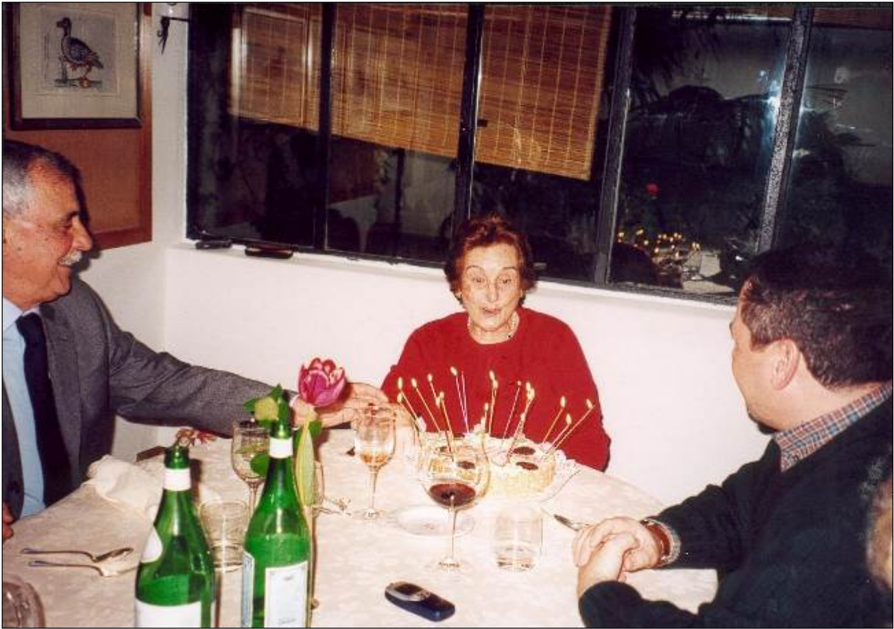
Una testa così.